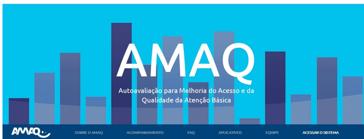
Figura 1: Página Inicial do AMAQ

Quando abrir a tela, o usuário deve clicar no menu superior, na opção “Acessar o Sistema”.