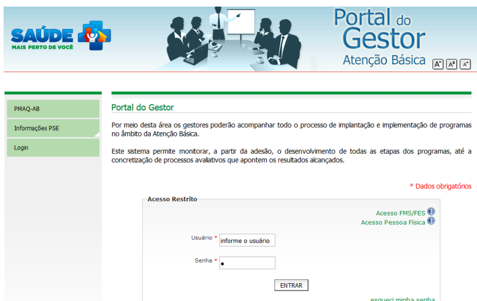
Figura 3: Página de Login no Portal do Gestor

ATENÇÃO, A SENHA E O USUÁRIO SÃO OS MESMOS UTILIZADOS NO PORTAL DO GESTOR.